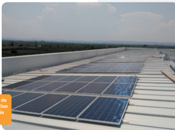
Instalación de autoconsumo sobre el agua sur de la cubierta de la nave principal | Self-consumption installation on the south-facing roof of the main warehouse

Las nuevas instalaciones de Edicions Bromera son básicamente para uso logístico y de oficinas, y su consumo es de unos 80.000 kWh anuales, en un régimen de días laborables. Por tanto, hubo